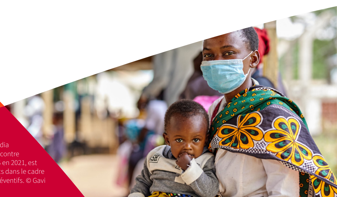
Photo : Grâce à des projets pilotes cofinancés par Unitaid, le Fonds mondial et Gavi, le premier vaccin au monde contre le paludisme, recommandé par l'OMS en 2021, est actuellement administré à des enfants dans le cadre d'un programme complet de soins préventifs.

Nous collaborons avec les communautés pour identifier les nouvelles difficultés et les populations défavorisées. Nous investissons dans des technologies de pointe et des approches innovantes qui renforcent la réponse au paludisme.